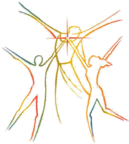
La Giffra nasce dal cuore di Francesco d'Assisi